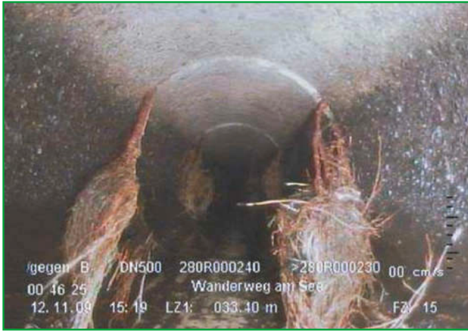
Wurzeln im Rohr

stanien längs des Krückauweges. Diese Kastanien wären bei einer Erneuerung des Rohrsystems an gleicher Stelle extrem gefährdet, höchstwahrscheinlich sogar abgängig. Das kann keiner ernsthaft wollen. Über die Sohlgleite wäre die Entwässerung mit einfachen Mitteln möglich. Es entfielen die Erneuerung der Rohrleitung. Der Bestand der Bäume wäre gesichert. Der Gebührenzahler für Regenwasser profitiert ebenfalls von solch einer (kostengünstigeren) Lösung. Denn die Kosten sind über die Gebühren wieder einzuholen.