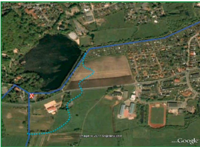
Bild vom geplanten Gebiet, keine Verlaufsplanung